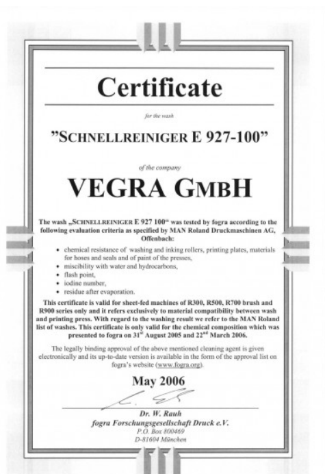
Certificat FOGRA pour MAN Roland