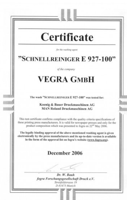
Certificat FOGRA pour KBA et MAN Coldset